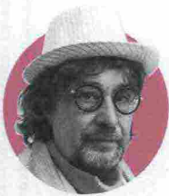
di Aldo Nove