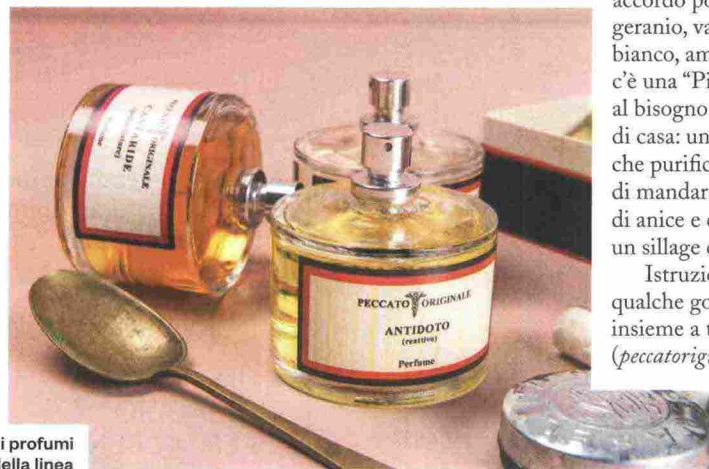
Alcuni dei profumi della linea "Peccato originale".

Istruzioni per l'uso: qualche goccia al bisogno, insieme a tanta ironia ( peccatoriginale.com ).