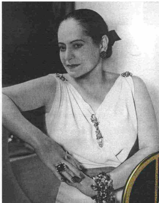
A sinistra, un ritratto di Helena Rubinstein, pioniera della cosmetica e, sotto, un suo portacipria. In mostra a Vienna fino a maggio.