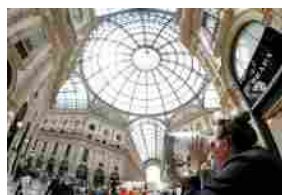
Giornata della lentezza, domani in Galleria la Zona del Tempo Lento