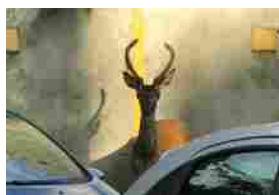
Un cervo tra le auto per le strade di Milano