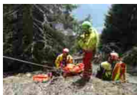
Precipita un aliante in Valtellina, pilota ferito