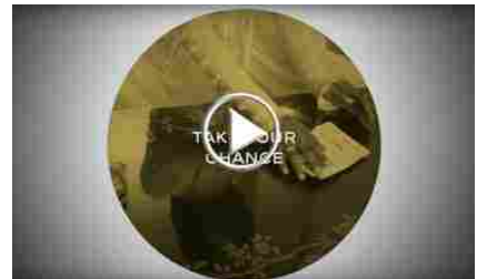
La 'chance' di Chanel