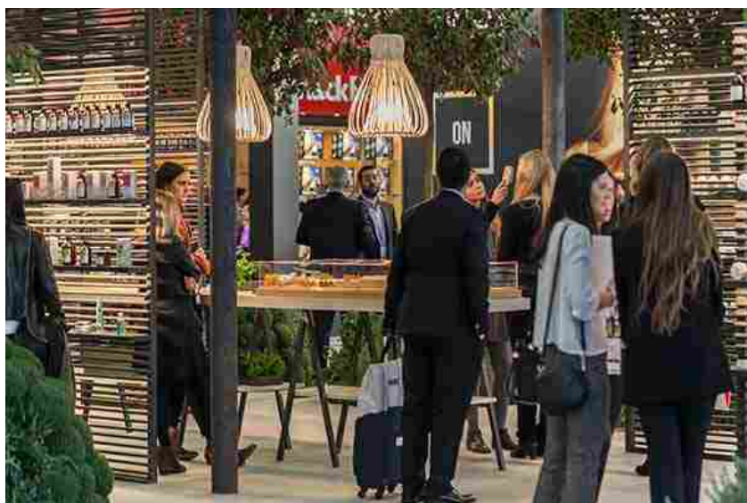
Cosmoprof Worldwide Bologna