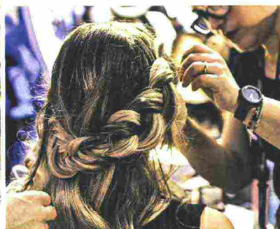
Da sinistra: una ragazza durante un trattamento estetico con apparecchi hi-tech; prodotti erboristici di bellezza; un'hair stylist all'opera nel padiglione dedicato ai capelli.

chi minuti dalla fiera di Bologna si trova Fico, primo parco tematico dedicato all'eccellenza enogastronomica italiana ( eatatworld.it ): il quotidiano americano The New York Times l'ha definito "imperdibile", quindi sapete già dove fare la pausa pranzo quando visiterete il Cosmoprof ( cosmoprof.com ).