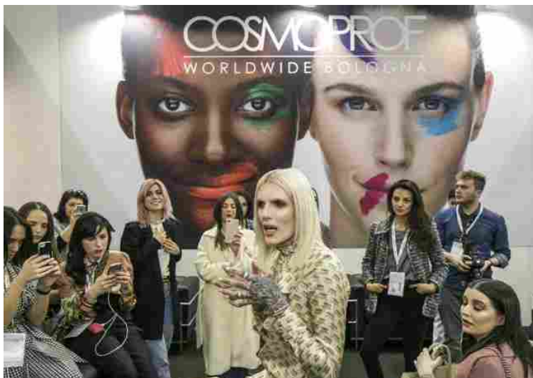
Tra gli ospiti attesi a Cosmoprof 2018 c'è Jeffree Star, make up artist e beauty star di Instagram (con quasi 6 milioni di followers), creatore della linea di trucco Jeffree Star Cosmetics.

Due sono i trend della 51esima edizione: la cosmetica green e quella multiculturale . La prima (con 130 aziende che la rappresentano) registra un grande sviluppo contemporaneamente alla crescita dell'interesse verso uno stile di vita più sano ed etico. I padiglioni che la ospitano (21N e 19) accolgono brand che producono cosmetici organici , biologici ed eco-sostenibili. Qui è possibile scoprire prodotti così naturali da poterli anche mangiare (li produce l'azienda danese Ecooking); alcuni dal pack in bambù (dell'indiana Omorfee); smalti cinesi realizzati senza toluene, formaldeide, canfora e DBP (di Color Mad); cosmetici creati con principi attivi estratti da piante spontanee (dell'italiana Alkemy); spazzolini da denti biodegradabili (dell'inglese My White Secret).