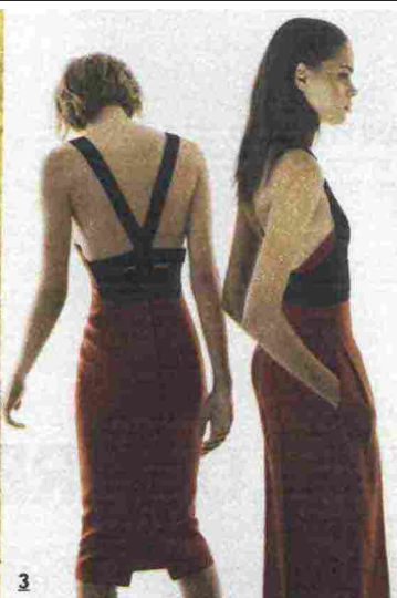
1 La top model Raquel Zimmermann, testimonial della fragranza. 2, 4, 6 Legno di cedro, iris e vetiver. 3, 5 Proposte dalla collezione P/E di Narciso Rodriguez.