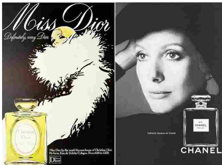
1947 – Miss Dior; 1972 – Catherine Deneuve volto dell'iconico Chanel N°5.

Se nel 1921 l'iconico N°5 di Mademoiselle Chanel e il prezioso Joy di Jean Patou , anticipano i primi floreali intensi e preziosi da donna, “è il secondo dopoguerra l'epoca che segna la nascita delle più grandi fragranze femminili di carattere ”, spiega Accademia del Profumo . Era il 1947 quando Monsieur Christian Dior volle accompagnare la rivoluzione della sua moda con una fragranza altrettanto irriverente, moderna, elegante: Miss Dior , seguita da Diorissimo , che voleva essere il più fresco e trasparente dei femminili dell'epoca. La maison Lancôme , nata nel 1949, esordisce in profumeria con Envol nel '57, un mix fiorito e verde sinonimo, per tanti, di abbraccio di mamma. O ancora, è del 1959 Jasmal di Creed , opulento nel suo bouquet essenziale di gelsomini italiani. Era l'epoca dei profumi aldeidati , arricchiti cioè di special molecole derivate dagli zuccheri capaci di rendere particolarmente cristallini, puri e frizzanti i protagonisti indiscussi dei bouquet, i fiori. Rose preziose e gelsomini restano, a oggi, gli inconfondibili di ogni bouquet classico.