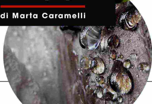
Illustrazione Lucille Clerc