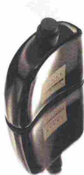
In alto, uno scatto della nuova campagna di Scent Intense di Costume National. Sopra, il flacone nero dalle linee minimali scolpito da Ennio Capasa.

di fiori di ibisco e rosa orientale, su un fondo sensuale a base di ambra grigia, vaniglia e patchouli. Il flacone in vetro nero opaco rimane fedele all'originale, modellato con la creta dalle mani dello stesso Capasa: la forma riproduce le spalle di una donna e si tinge di rosso per la nuova versione Red Edition Parfum, con una concentrazione ancora più alta che resta persistente sulla pelle. Una nuova campagna rende omaggio all'heritage della maison: immagini in bianco e nero immortalano il protagonista, una giovane rock star che sale sul palco indossando un chiodo aperto e un paio di pantaloni skinny in pelle. MICHELE MEREU