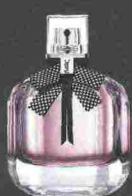
YSL MON PARIS COUTURE