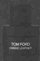
TOM FORD OMBRE LEATHER