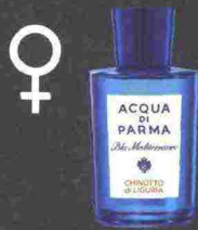
ACQUA DI PARMA CHINOTTO DI LIGURIA