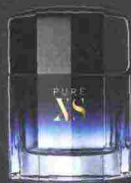
PACO RABANNE PURE XS