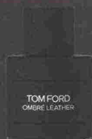
TOM FORD OMBRE LEATHER