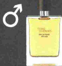
HERMÈS TERRE D'HERMÈS EAU INTENSE VETIVER