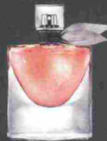
LANCÔME LA VIE EST BELLE