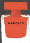
NARCISO RODRIGUEZ EDP ROUGE