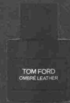
TOM FORD OMBRE LEATHER