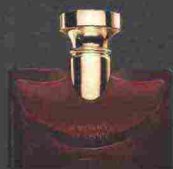
BULGARI SPLENDIDA MAGNOLIA SENSUEL