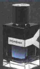
YSL Y EDP