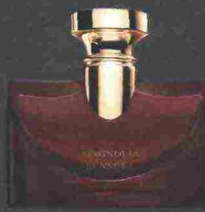
BULGARI SPLENDIDA MAGNOLIA SENSUEL