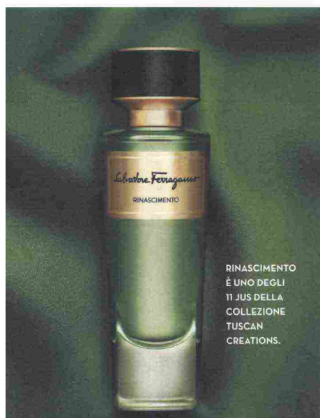
RINASCIMENTO È UNO DEGLI 11 JUS DELLA COLLEZIONE TUSCAN CREATIONS.

Quali sono i valori del progetto? «Penso che al centro ci siano l'autenticità e la qualità in tutti i dettagli della colle-