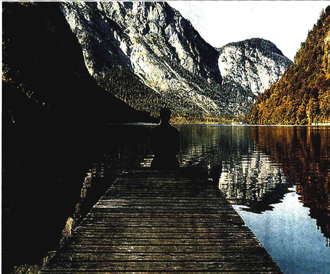
Bccc. La B Corp Climate CollectiveT è un gruppo di aziende B Corp impegnate sul problema del cambiamento climatico che sostengono iniziative come Net Zero per ridurre le emissioni di Co2 entro il 2030 tra cui c'è anche il gruppo Davines

L'associazione di categoria raggruppa oltre 600 aziende. Aderisce a Federchimica ed è membro di Cosmetics Europe